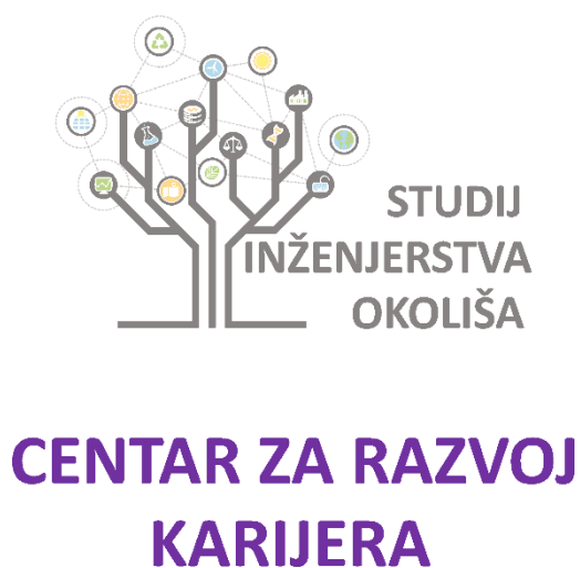
Slika 2. Logotip CRK u boji – uspravna inačica