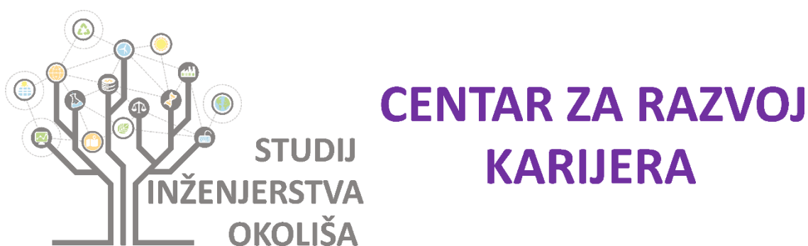
Slika 1. Logotip CRK u boji – vodoravna inačica

Logotip CRK predstavlja kombinaciju logotipa studijskog programa Inženjerstvo okoliša s tekстом Centar za razvoj karijera u više izvedenica. Definiran je u punoj boji, bijeloj boji i tonovima sive boje. Inačica u boji sadrži tekst „CENTAR ZA RAZVOJ KARIJERA“ u ljubičastoj boji koja je karakteristična za ESF projekt UP.03.1.1.04.0059 Stjecanje ključnih praktičnih vještina u području inženjerstva okoliša .