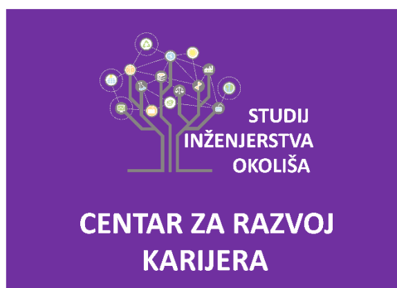
Slika 5. Logotip CRK u bijeloj boji – uspravna inačica